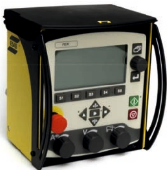
A2-A6 Контроллер процесса PEK

Достоинства: программируемая память на 255 параметров, понятное текстовое меню на 17 языках, USB вход для карт памяти резервных копий данных, перенос данных, мониторинг производства, обновление ПО и т.д. На дисплее в режиме реального времени можно наблюдать действительную величину тепловложений. Точное управление скоростью осуществляется за счет управления приводных электродвигателей с помощью кодирующих устройств.